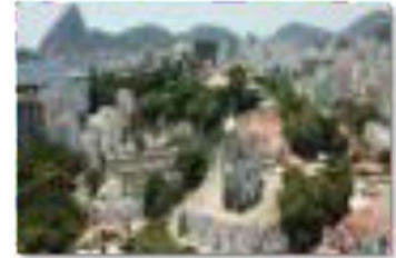
Casa França Brasil - 1820