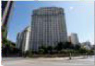
Edifício A noite - 1920