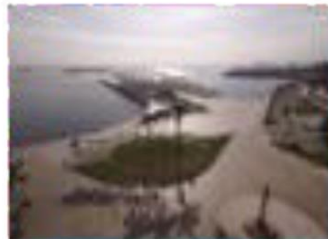
Orla Luiz Paulo Conde - 2017