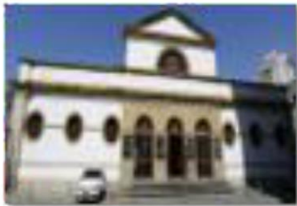
Outeiro da Glória - 1739