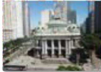
Theatro Municipal - 1909